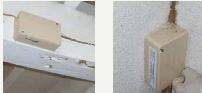
Boîtiers Sentribox , discrets et sécurisés, placés sur les zones de passage des termites

% de communes termitées par département (d'après FCBA) Édition mars 2018.